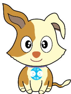
行政相談のマスコット キクーン

また、行政相談委員全体会議に引き続いて開催される群馬行政相談委員協議会総会において、行政相談委員活動に関し顕著な功績のあった 委員1名に全国行政相談委員連合協議会会長表彰状 が贈呈されます。